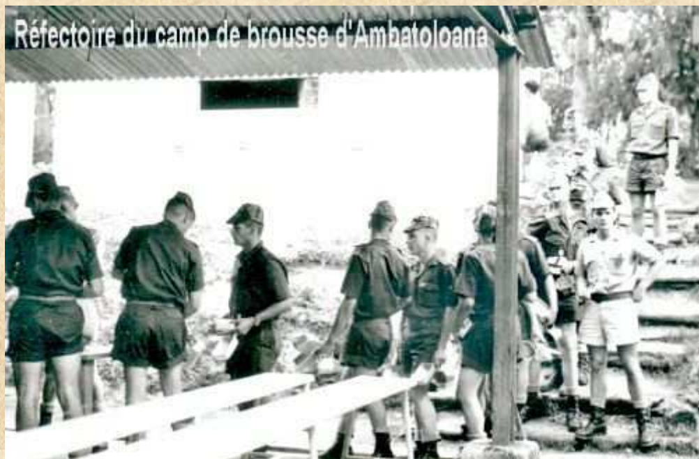
Réfectoire du camp de brousse d'Ambatoloana