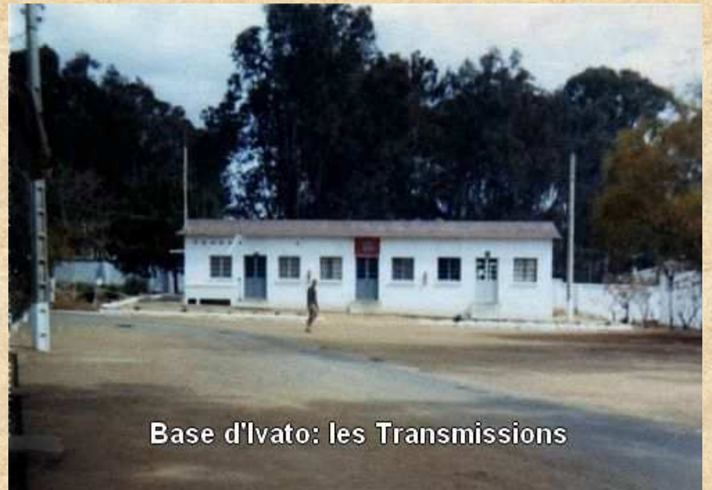
Base d'Ivato: les Transmissions