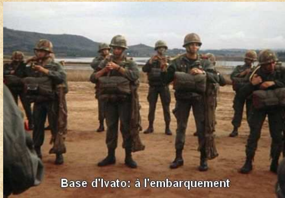
Base d'Ivato: à l'embarquement