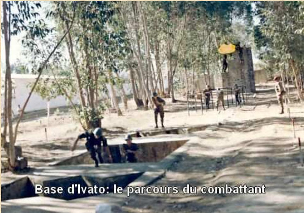
Base d'Ivato: le parcours du combattant