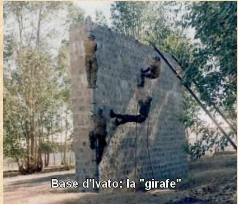
Base d'Ivato: la "girafe"