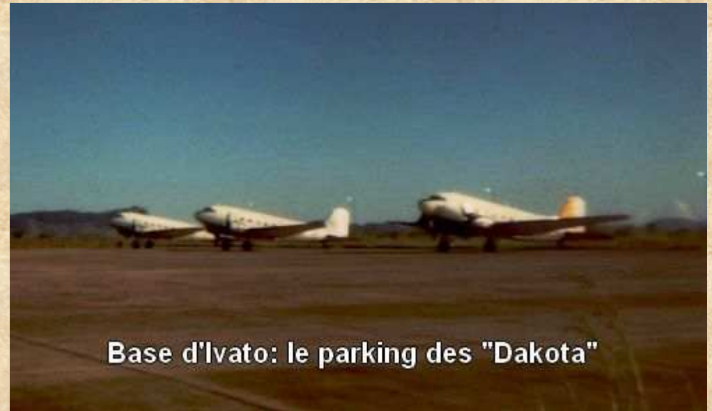
Base d'Ivato: le parking des "Dakota"