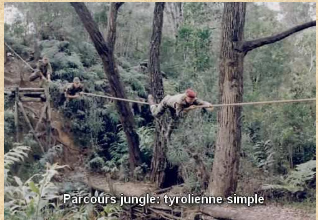
Parcours jungle: tyrolienne simple