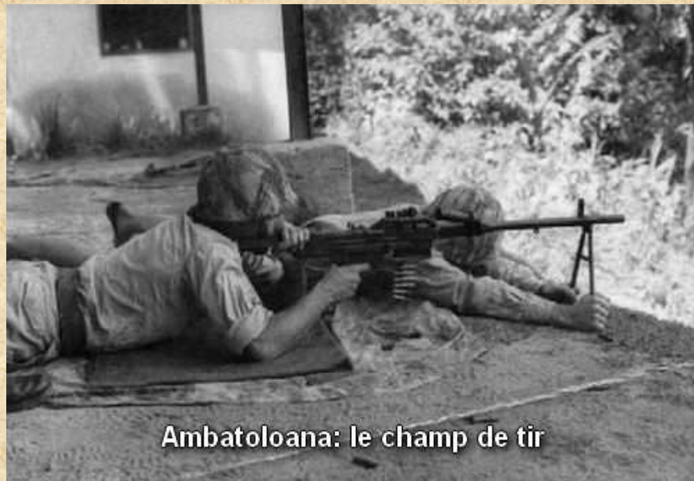
Ambatoloana: le champ de tir