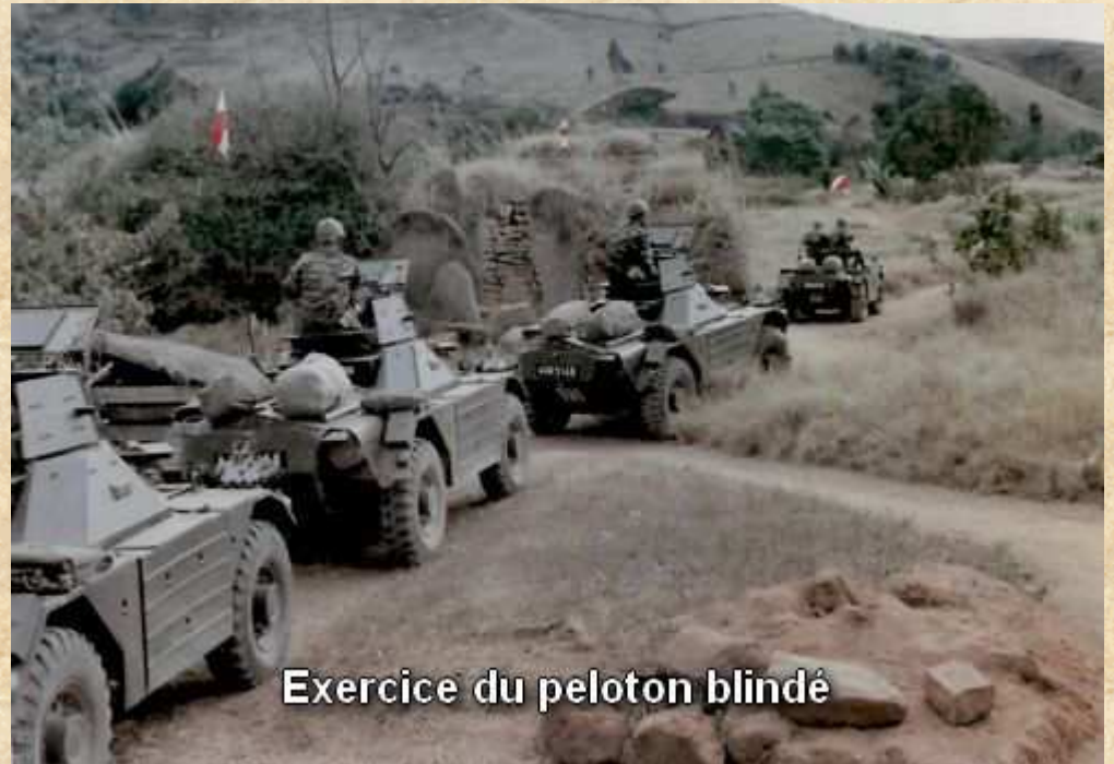
Exercice du peloton blindé