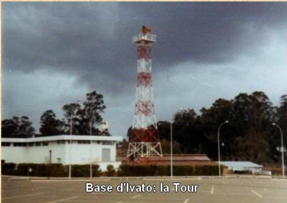
Base d'Ivato: la Tour