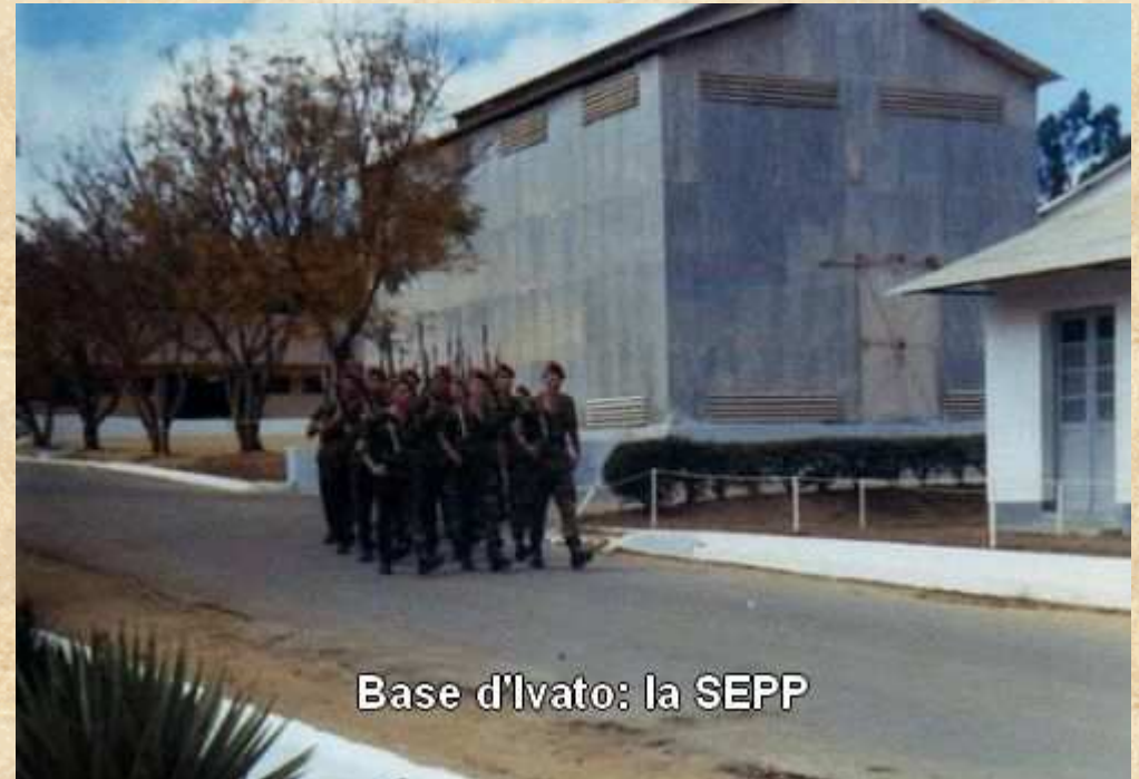
Base d'Ivato: la SEPP