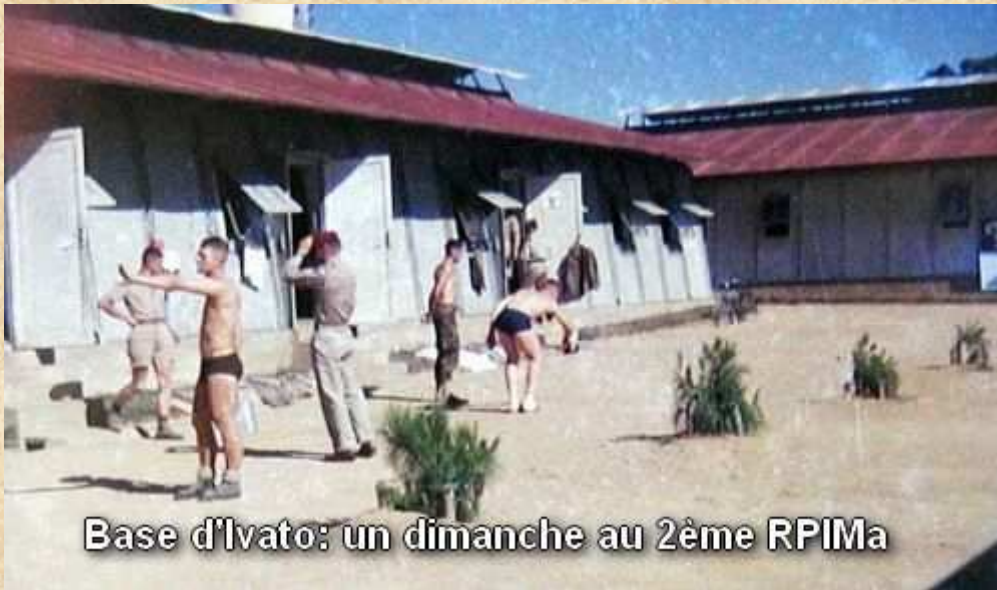
Base d'Ivato: un dimanche au 2ème RPIMa