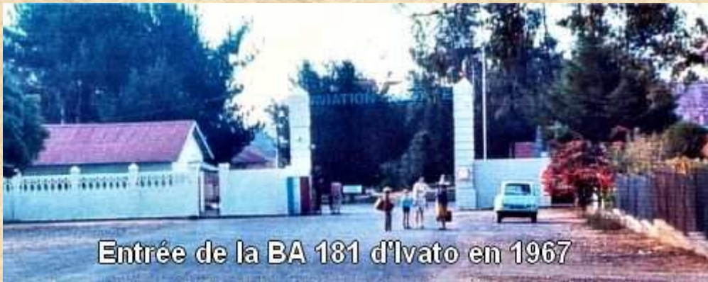
Entrée de la BA 181 d'Ivato en 1967