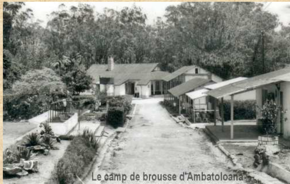
Le camp de brousse d'Ambatoloana