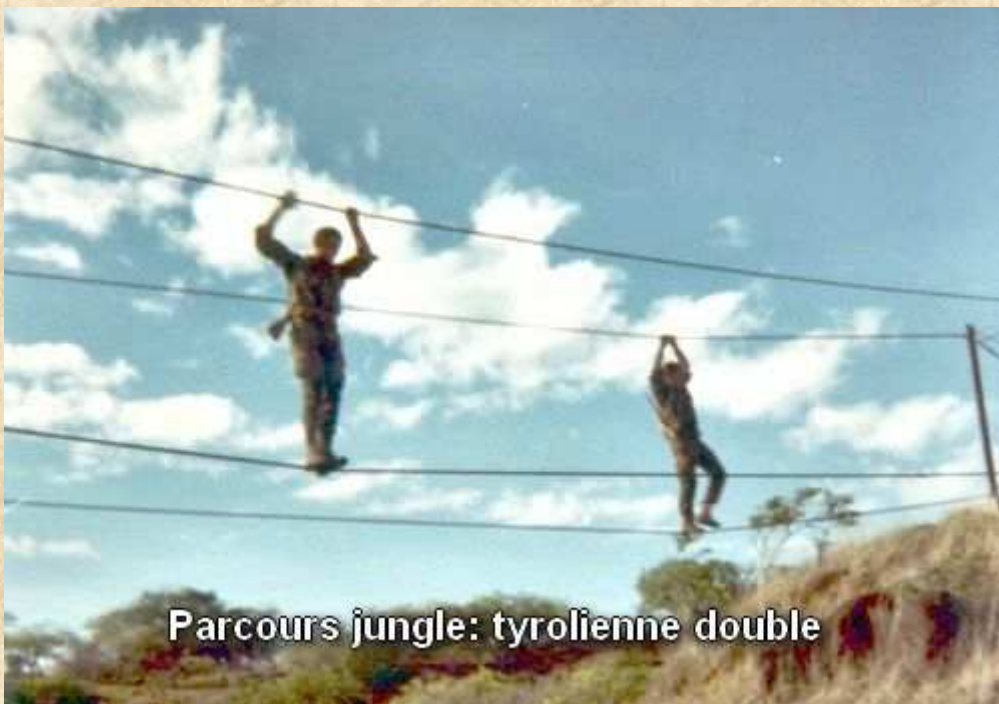
Parcours jungle: tyrolienne double