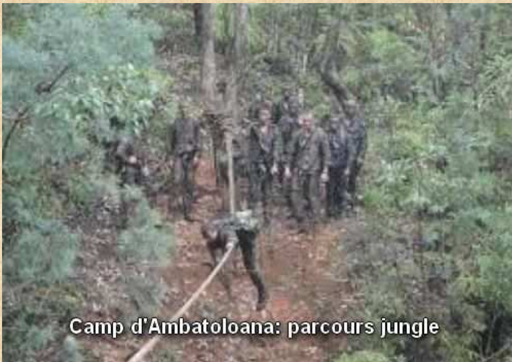
Camp d'Ambatoloana: parcours jungle