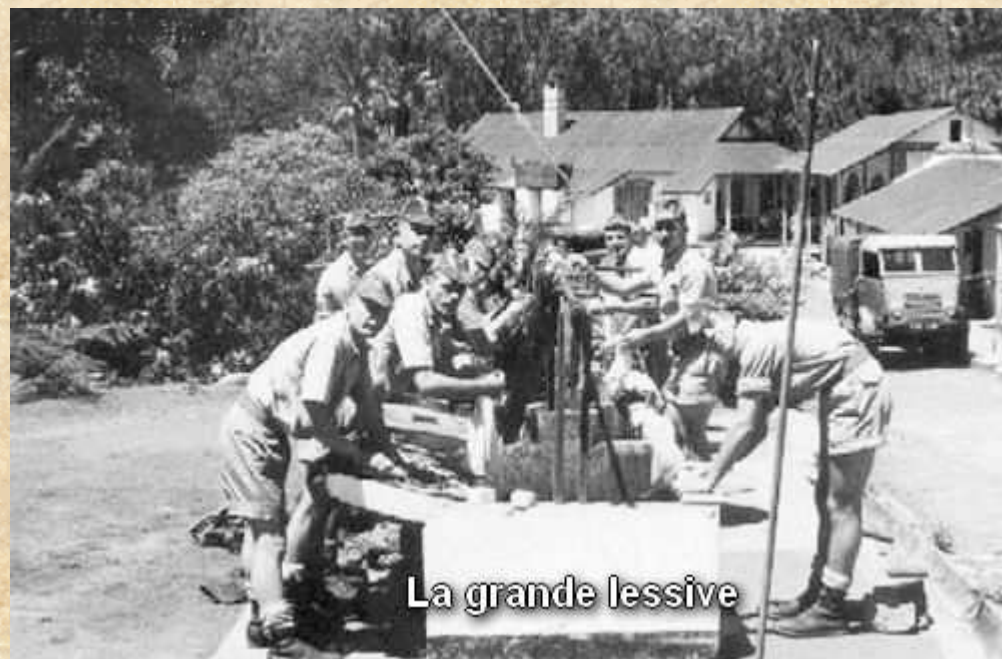
La grande lessive