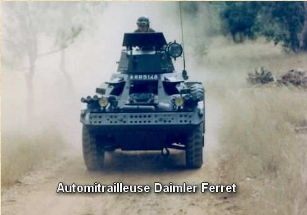
Automitrailleuse Daimler Ferret