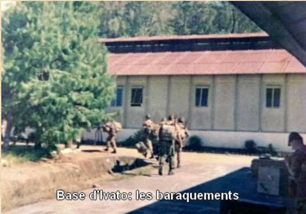
Base d'Ivato: les baraquements