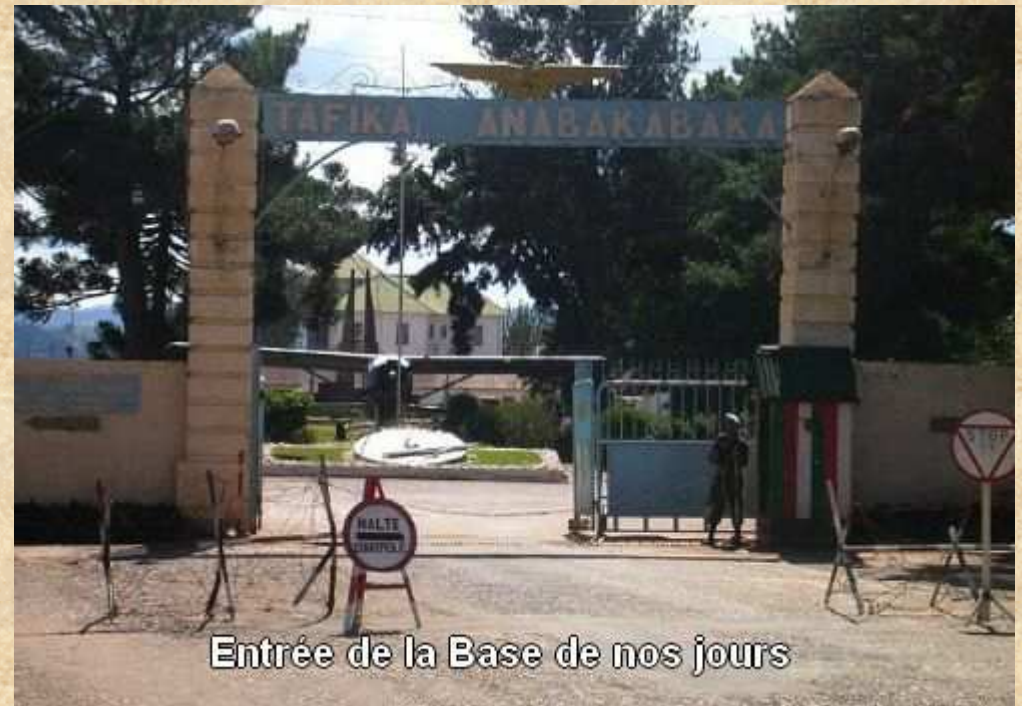
Entrée de la Base de nos jours