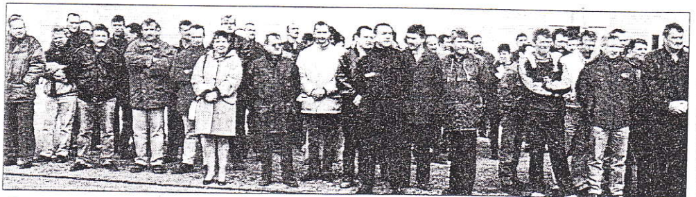
Des membres du personnel civil.