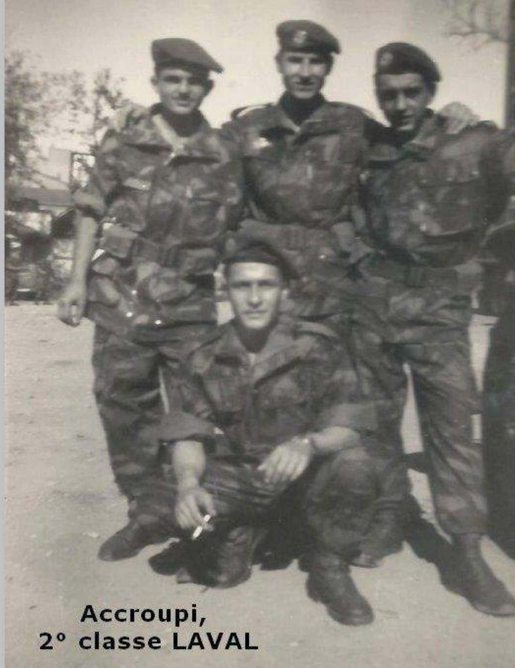
Accroupi, 2° classe LAVAL