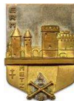
ERM Metz avant 1994