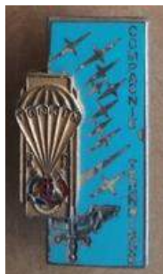
BOMAP - CT