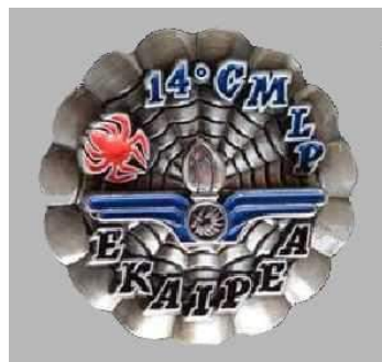
14 ème CMLP