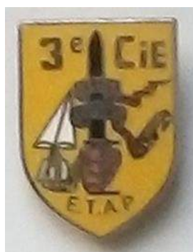
ETAP – 3 ème Cie