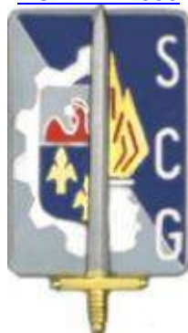
Service Central de Gestion