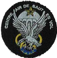
Centre Air de saut en vol