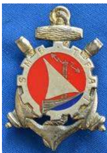
Service du Matériel des Bâtiments – Territoire Français des Afars et des Issas - SEP