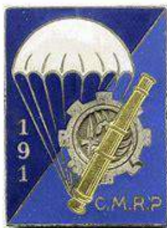
191 ème CMRP