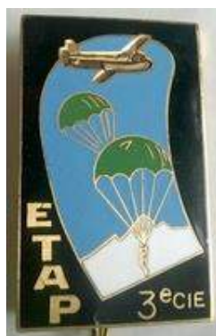
ETAP – 3 ème Cie