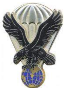
EM 11ème BP