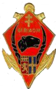
6 ème Régiment d'Interarmes d'Outre Mer - Tchad - SLA