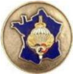
SSV - Romainville