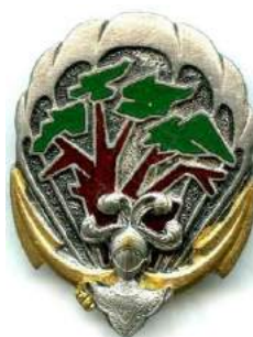
1 er Régiment d'Infanterie Interarmes d'Outre Mer - Sénégal - SLA