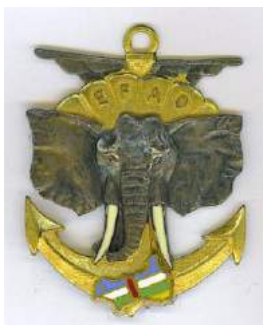
EFAO - RCA