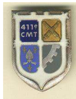
411ème CMT-DT 7