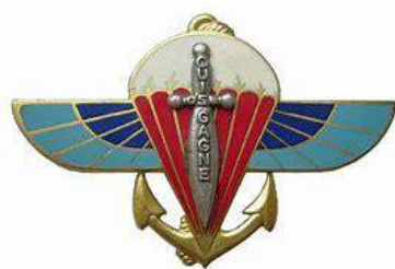
2 ème Régiment Parachutistes d'Infanterie de Marine – La Réunion - DTMPL