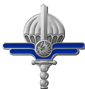
FS1 – CT1