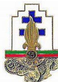
13 ème Demi Brigade de Légion Étrangère - Djibouti - DTMPL