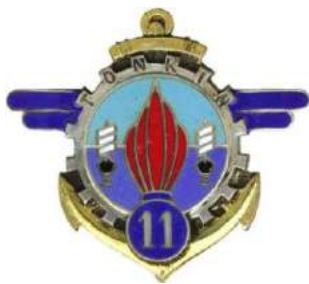
11 ème Compagnie d'Ouvriers du Service du Matériel