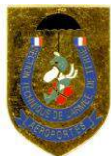
STAT - GAP