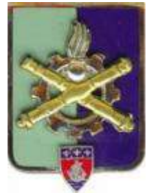
Direction Centrale du Matériel