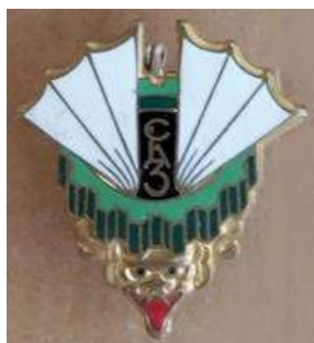
Compagnie de Livraison par Air n°3