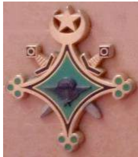
MAURITANIE : BCP