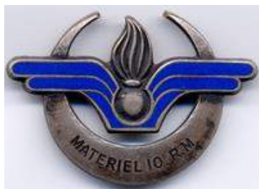
Direction du Matériel en 10 ème RM