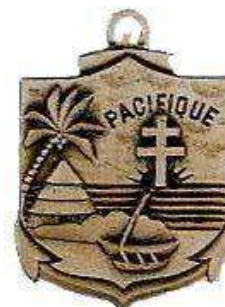
Régiment d'Infanterie de Marine du Pacifique -NC