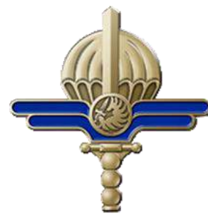
FSE - CTE