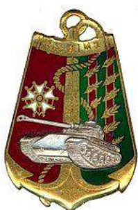
43 ème Bataillon d'Infanterie de Marine – Côte d'Ivoire - DTMPL