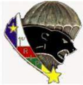
RCA : 1 er RIP