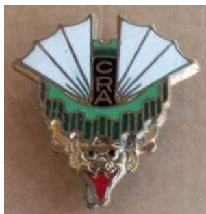
Compagnie de Ravitaillement par Air