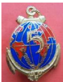
5 ème Régiment d'Infanterie de Marine d'Outre Mer – Djibouti - DTMPL