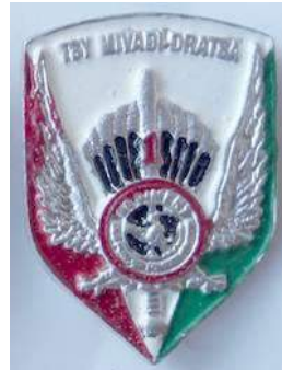
MADAGASCAR : 1RFI