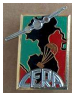
Compagnie Étrangère de Ravitaillement par Air