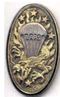
Base Aéroportée Sud