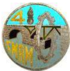
4ème CMMR - DT 48