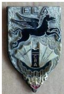
BOMAP - ELA