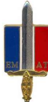
Etat-Major de l'Armée de Terre – Mission de conseil et d'assistance de la Maintenance