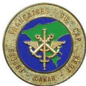
FFCV - Sénégal