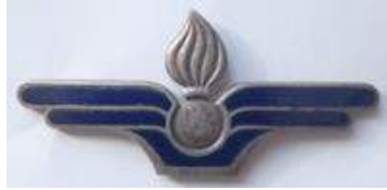
Service du Matériel