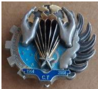
1er RTP - CT