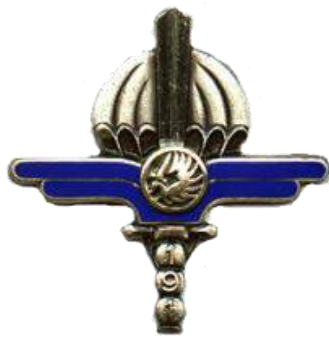
191 ème CREP