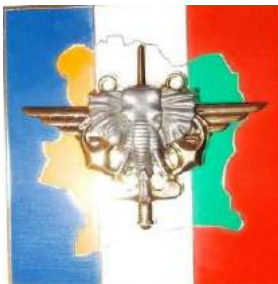
FFCI - Côte d'Ivoire