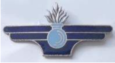
Service du Matériel