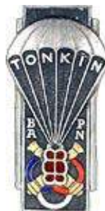
Base Aéroportée Nord