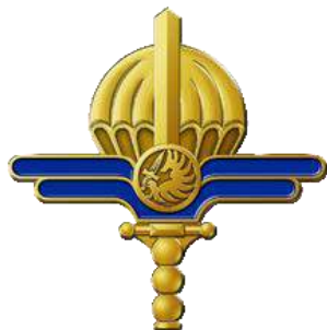
OFF – FS2 – CT2

S'inspirant de l'insigne de la première Section d'Entretien des Parachutes (191 ème SEP), créée en Algérie en 1947, et décliné par niveau technique détenu (CT2, CT1, CTE), l'insigne de spécialité MATPARA a été approuvé par le chef d'état-major de l'Armée de Terre par lettre n°505229 du 7 juin 2017 et homologué par décision ministérielle du service historique de la Défense sous les numéros suivants : GS.329 « or », GS.330 « argent », GS 331 « bronze ».