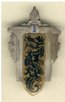
1 er Bataillon d'Ouvriers du Service du Matériel