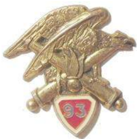
93 ème RAM