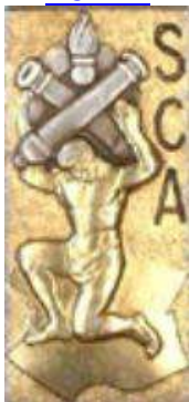
Service Central des Approvisionnements