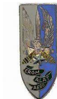
ERGM ALAT & Aéro