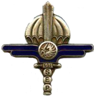
191 ème SEP