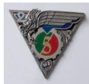
REP – 5 ème Cie